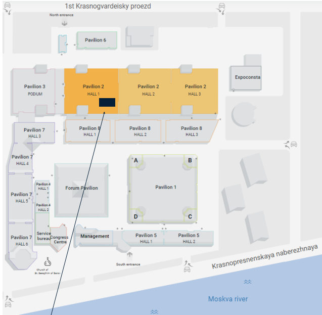
FRENCH PAVILION Business France Welcome Booth / Стенд Business France : 21E42